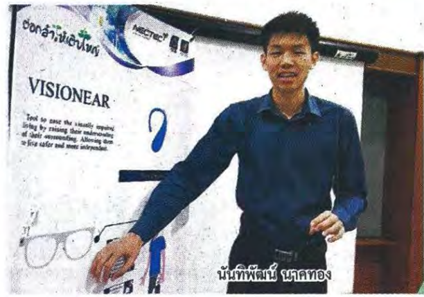
นวัตกรรมพิเศษ นวัตกรรมของ

ทั้งนี้ การจัดงานประการสำคัญคือ เพื่อให้อาจารย์ นักวิจัย นักศึกษา ได้มีเวทีแลกเปลี่ยนความรู้ในการนำเสนอผลงานวิจัย และสิ่งประดิษฐ์สำหรับคนพิการและผู้สูงอายุในเวทีประเทศไทย จากนั้นส่งต่อไปในเวทีระดับ